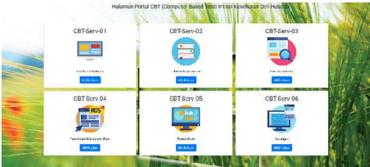
Gambar a : Halaman Depan Portal CBT