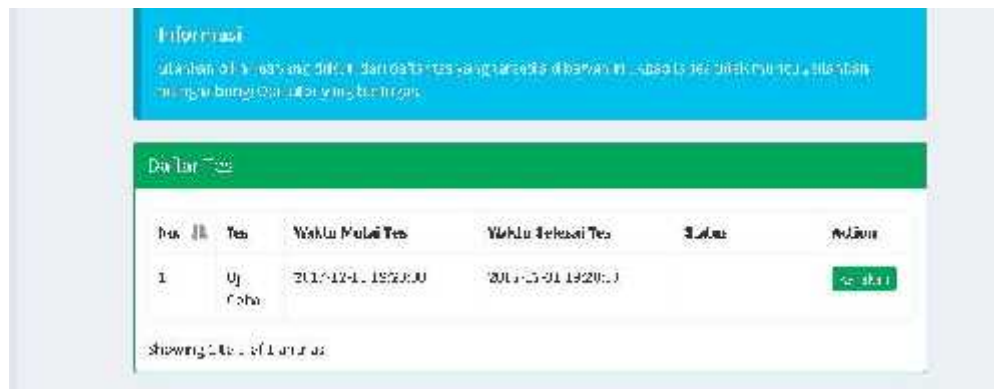
Gambar E : Halaman Mahasiswa Untuk melihat matakuliah yang aktif untuk ujian